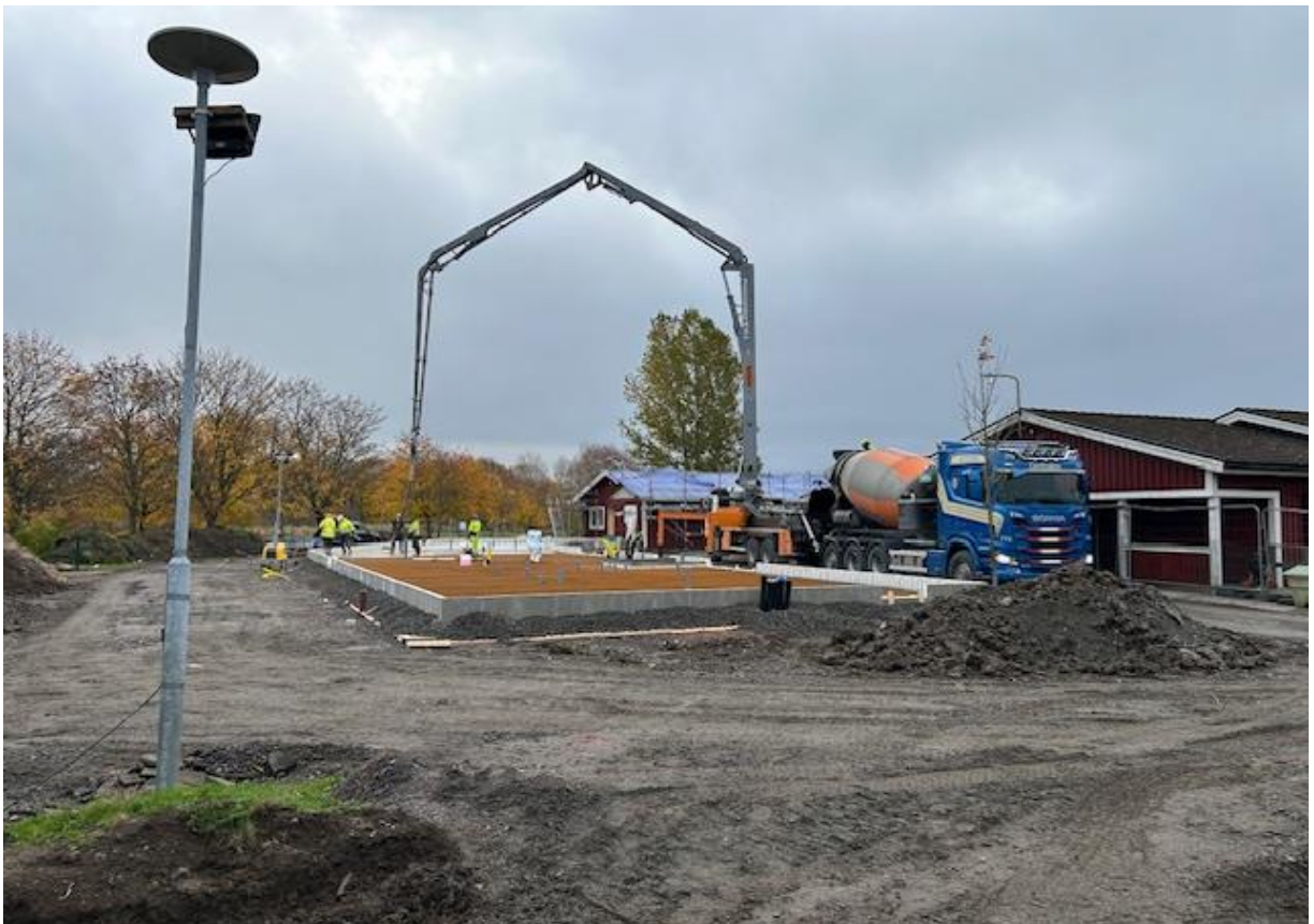
Gjutning bottenplatta Hus D 25/10