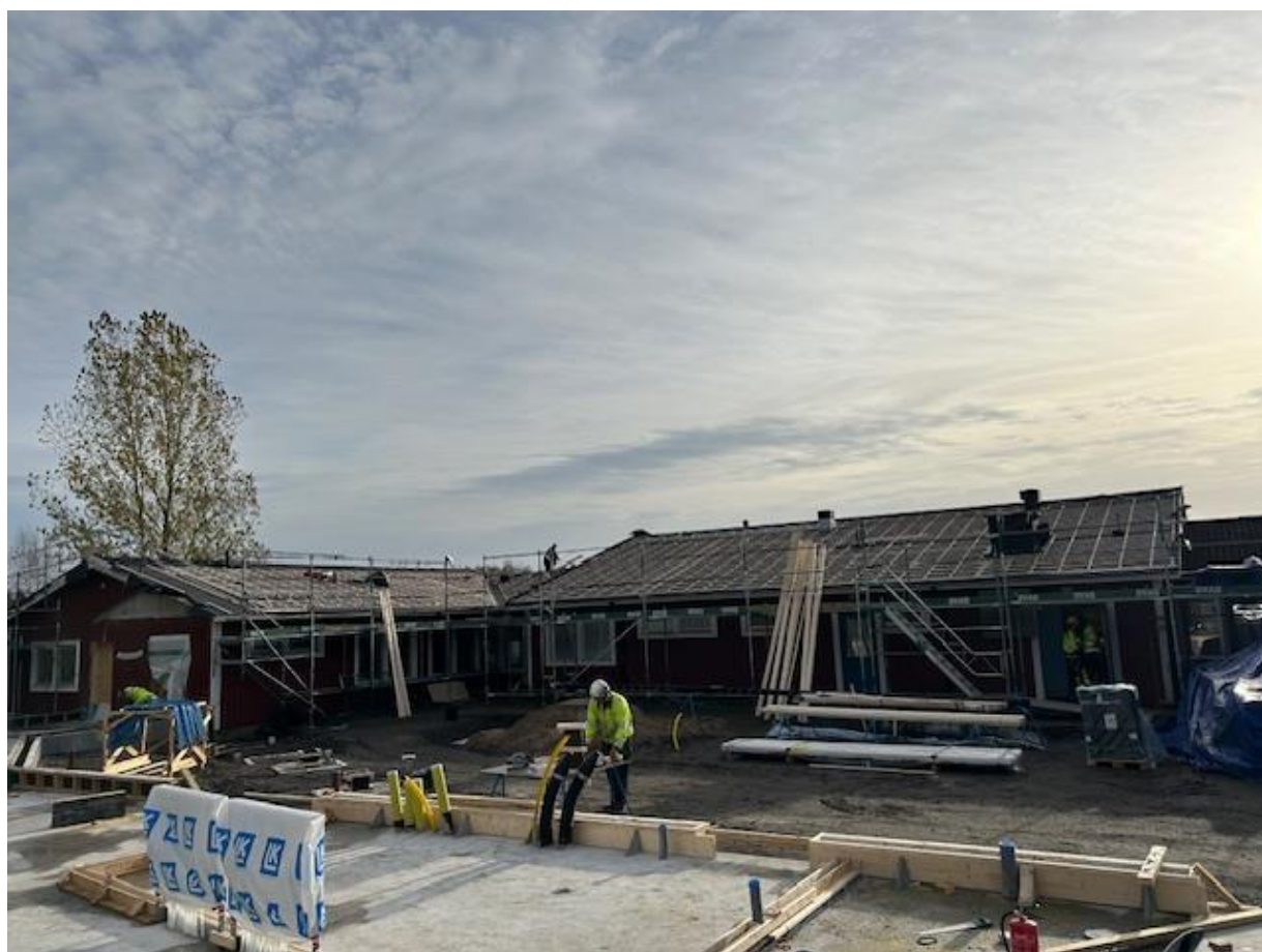
Nytt tak hus B och C är på gång