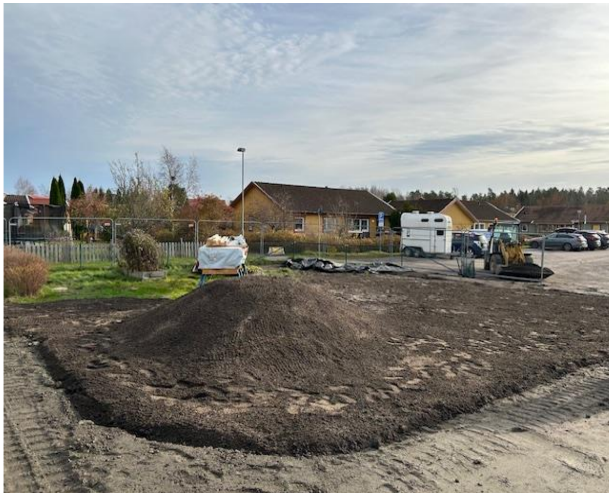
Ny kulle utanför Hus C