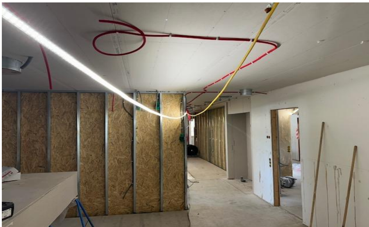
Invändiga arbeten i hus C