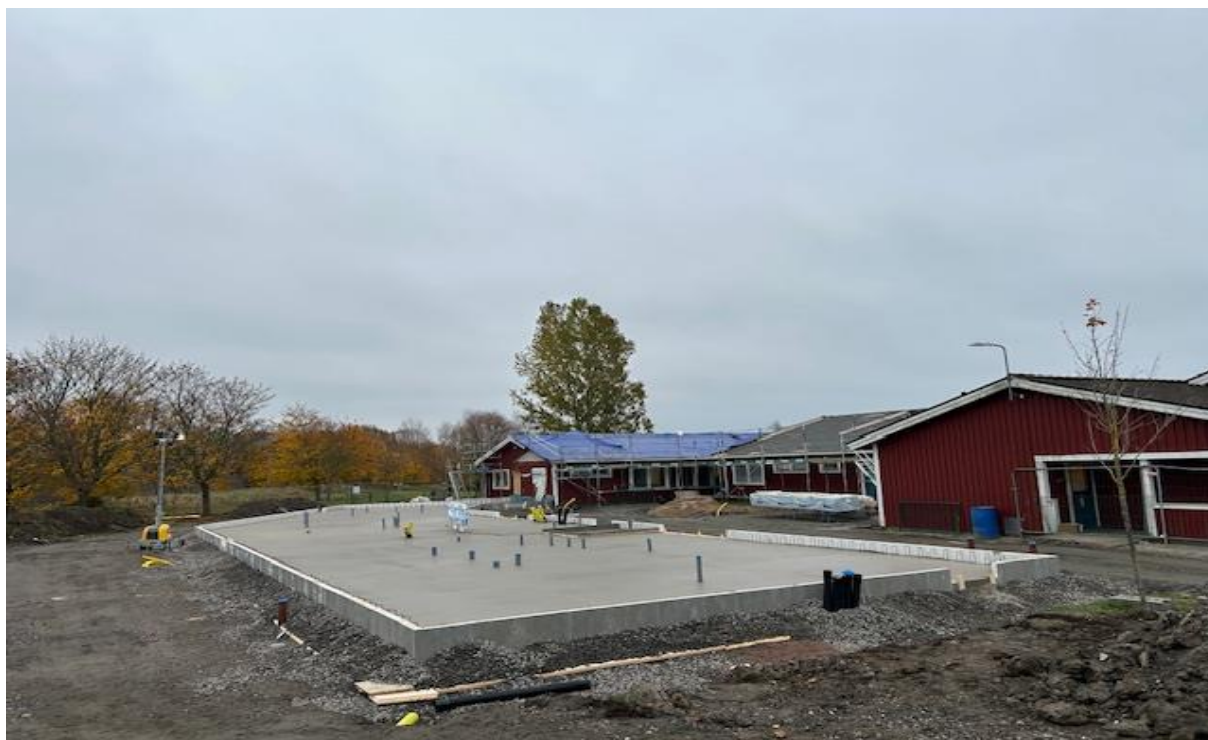
Gjutning bottenplatta Hus D 25/10