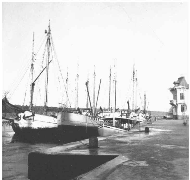
Gruset skulle ha färdats med båt från Sandön

Bror Emil Hildebrand föreslog att det skulle köpas från Sandön utanför Åmål. Dock visade det sig att Åmål ägde vissa rättigheter på Sandön och att de också var spekulanter på gruset.