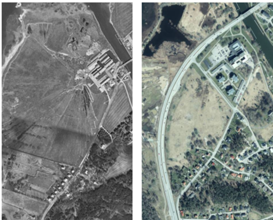
Figur 2. Foton från 1955-1967 respektive 2018-2020.

Det undersökta området är ca 230 x 420 m och utgörs av gräsbevuxen och delvis slybevuxen obebyggd mark. Det har delvis fyllts ut i området. I figur 2 nedan redovisas flygfotografier från tidsperioderna 1955-1967 respektive 2018-2020. Delar av fyllningen kommer sannolikt från byggena av väg 2026 (Edsvägen) och Korsebergavägen m.m.