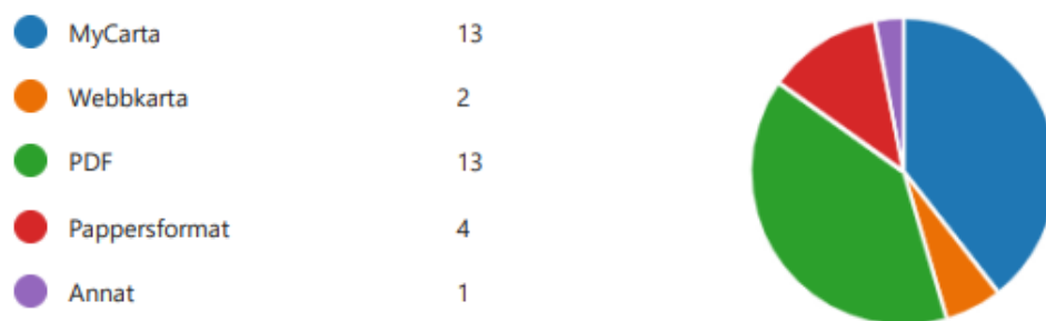
Figur 3 - Svar på frågan "När ÖP:n används, vilka format används främst?"

I princip alla anser att översiktsplanen ger tillräckligt stöd i deras arbete, exempelvis ger den bra vägledning för olika geografiska områden och tydliga riktlinjer för efterföljande plan- och bygglovsarbete. Exempel på när översiktsplanen inte ger stöd i arbetet är emellertid på landsbygden och avvägningen exploatering/bevarande (naturvärden).