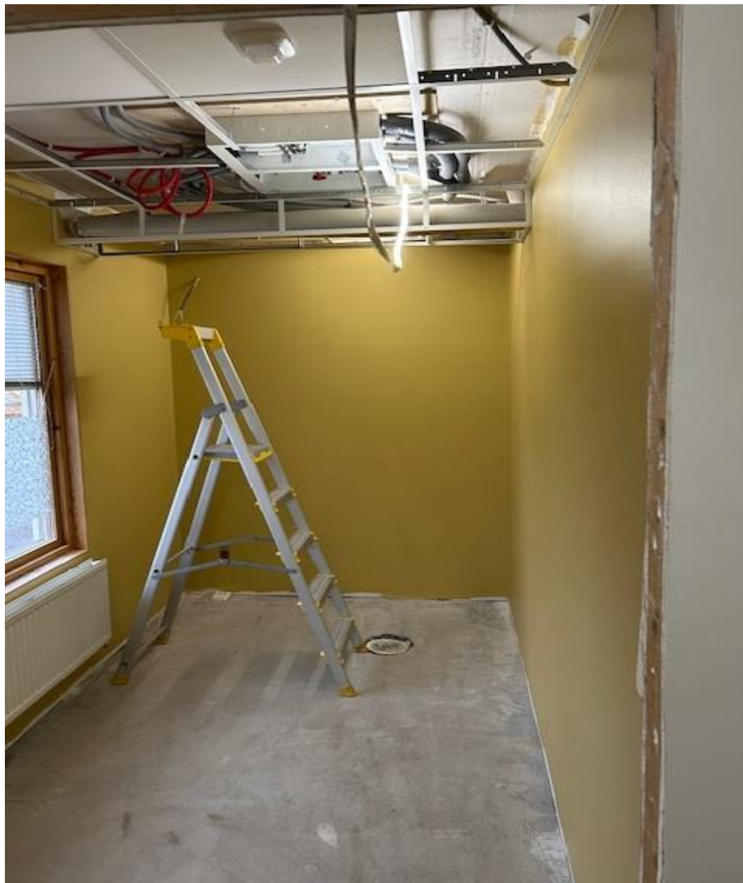
Hus C – Skötrum 131