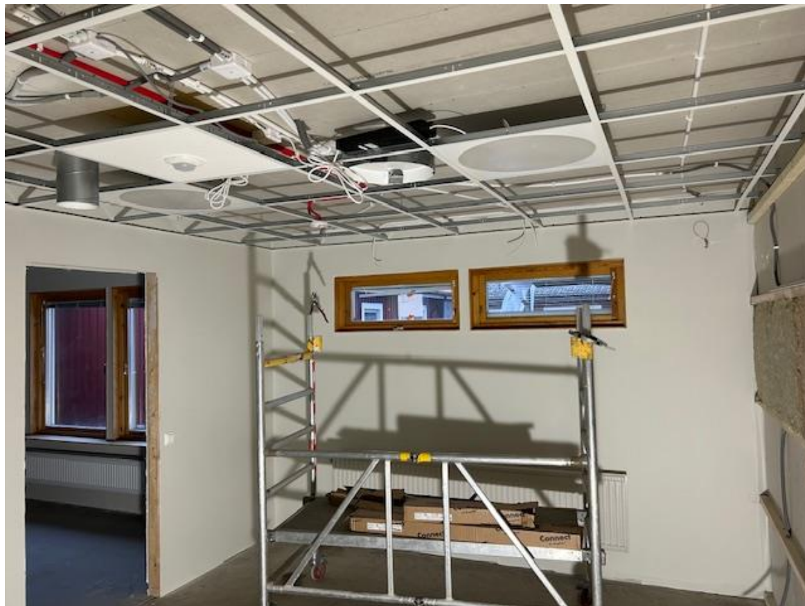
Hus C – Team C1 125