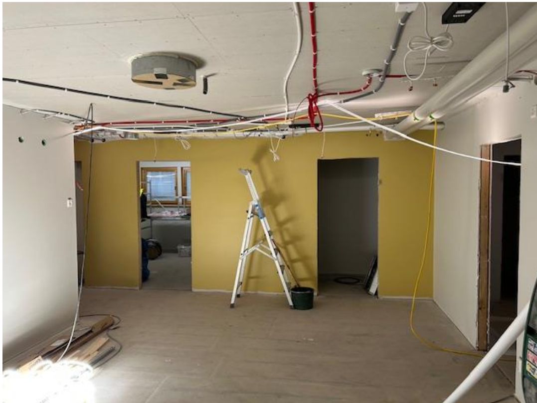
Hus C – Kapprum 123