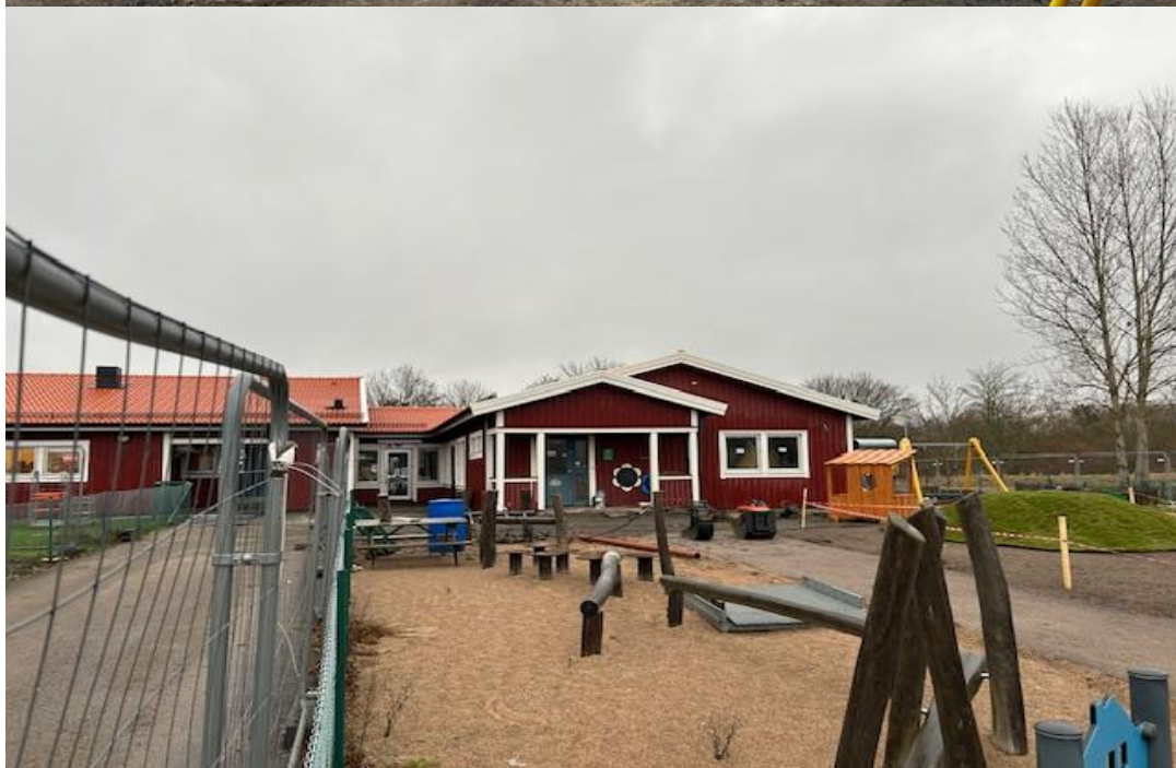
Nytt tak hus B och C