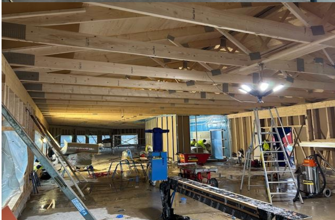
Hus D invändigt