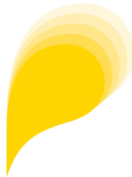
PANTONE 116 RGB 255 213 0 CMYK 0 15 94 0