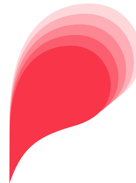
PANTONE 1787 RGB 220 65 79 CMYK 0 86 60 0