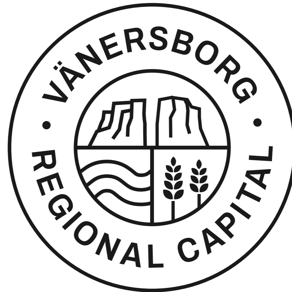
Engelsk variant av regionshuvudstadsstämpeln