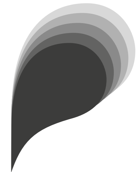
PANTONE 447 RGB 63 62 62 CMYK 0 0 0 90