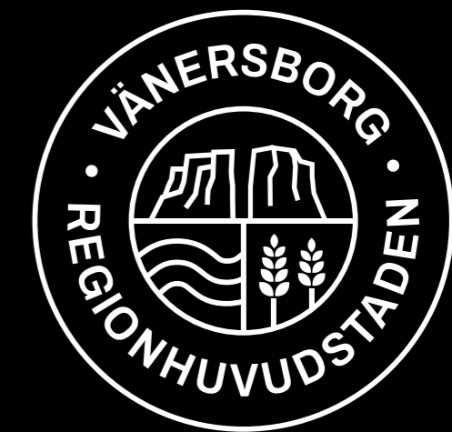
Negativ variant av stämpel