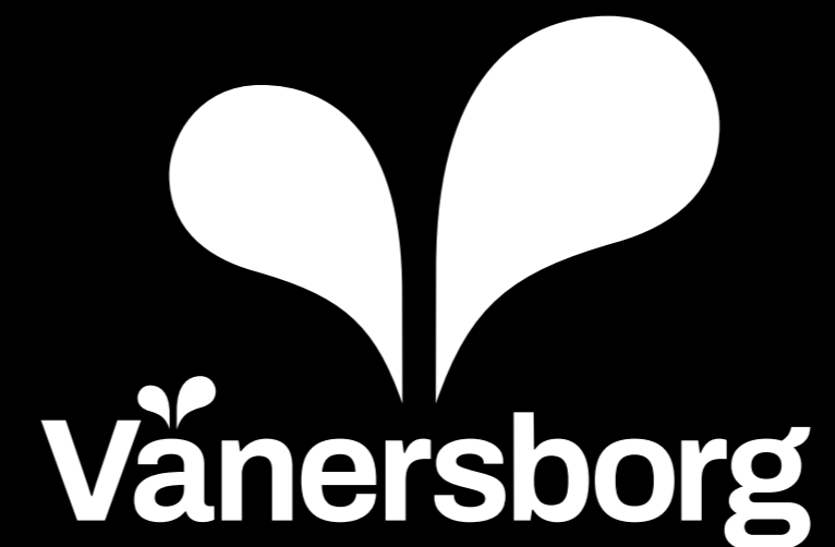
Negativ variant av symbollogotyp