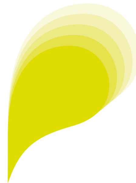
PANTONE 397 RGB 223 219 0 CMYK 20 0 100 0