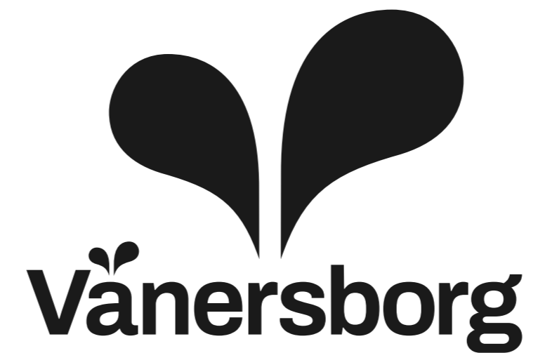
Svart variant av symbollogotyp