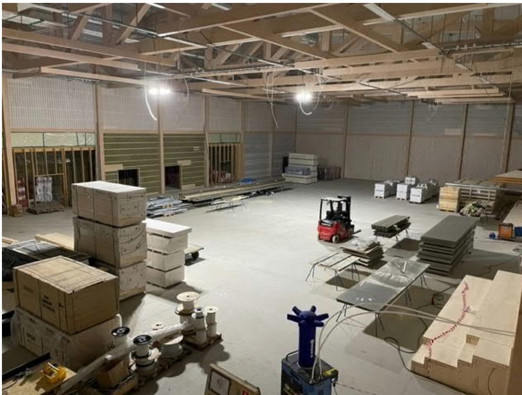
Idrottshallen används nu som lagerlokal.