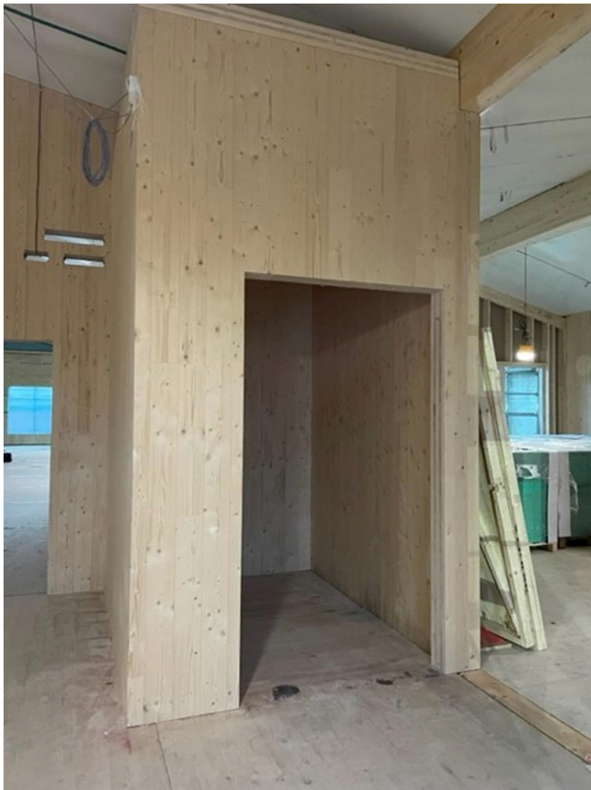
Hisschaktet på plan 2, byggt helt i trä.