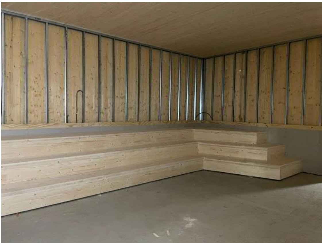
Gradängen i rum mediatek/grotta, Hus 3 plan 1.