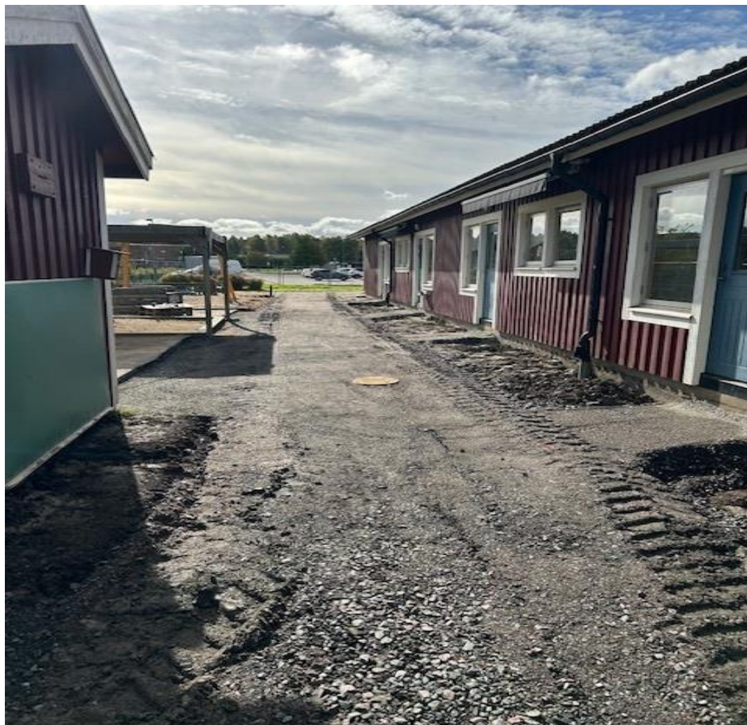
Daggvattenmagasinet är på plats och ytan återfylld