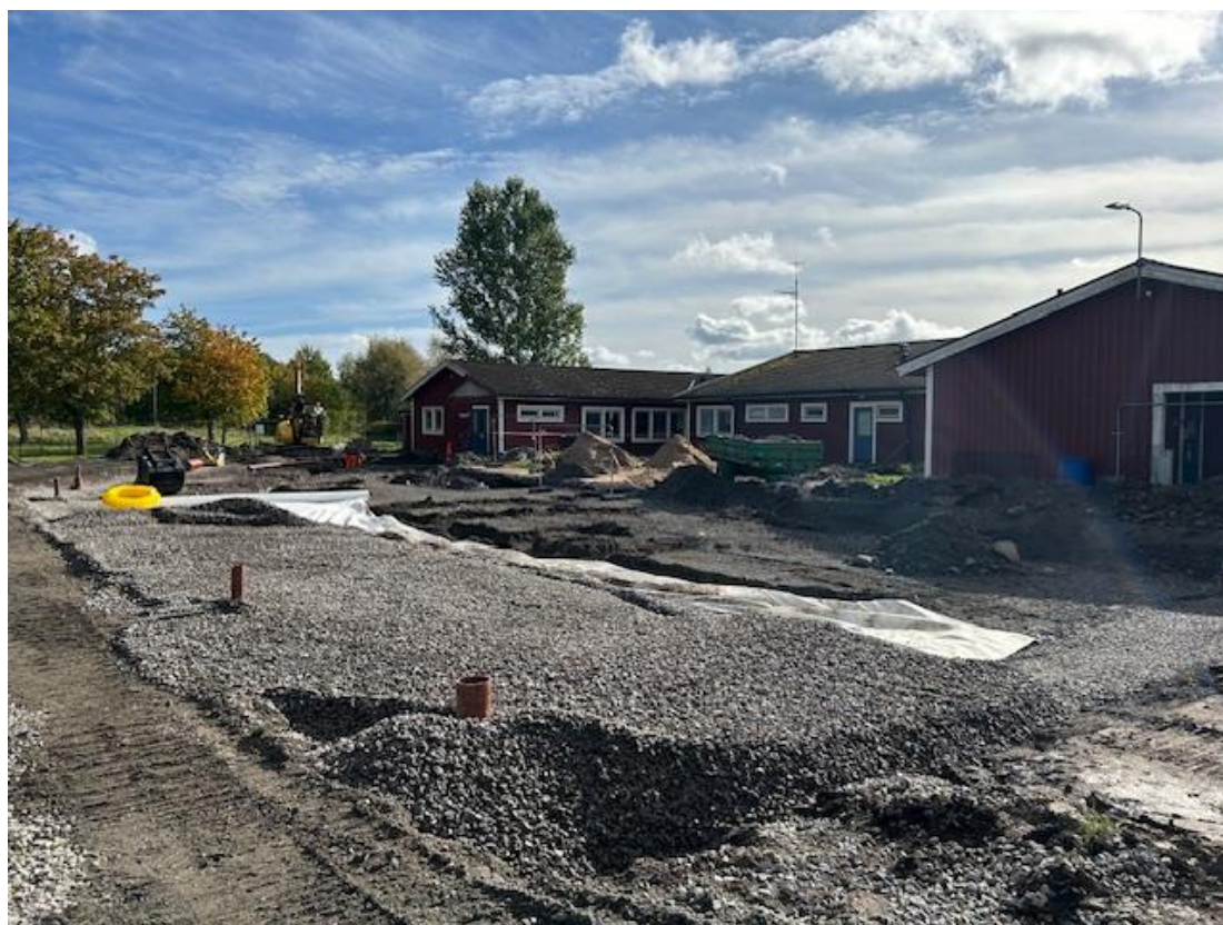
Grundarbeten Hus D