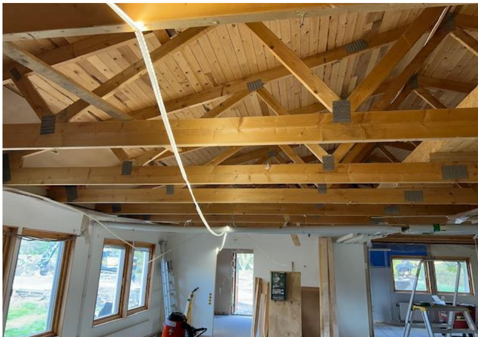
Rivning i hus C klar, rumsbildning påbörjat