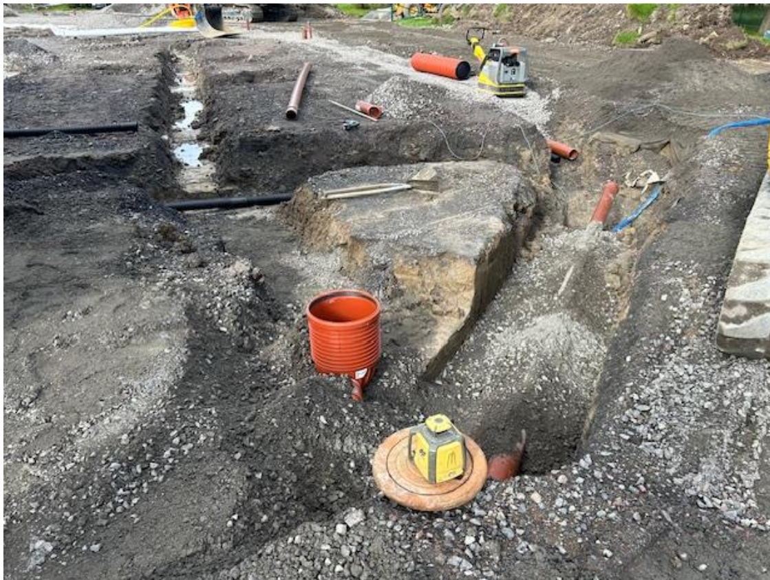
VA - arbeten Hus D